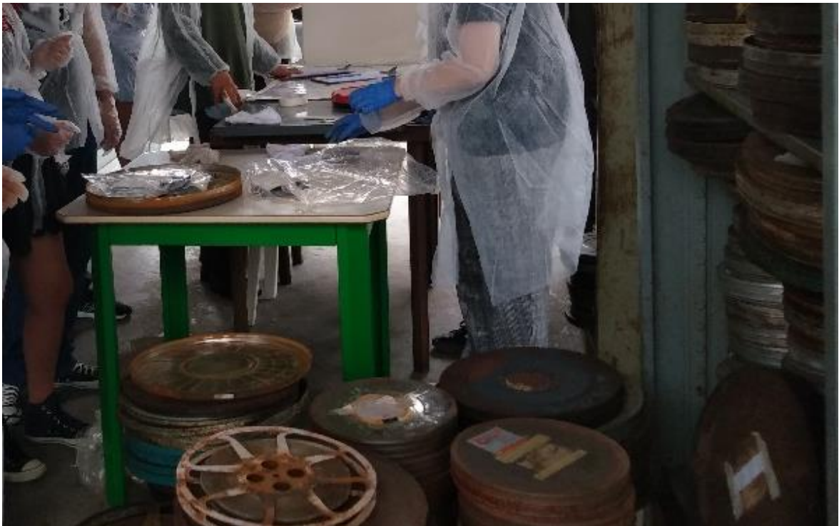
FIGURA 6 – MANUSEIO E LIMPEZA DAS PELÍCULAS