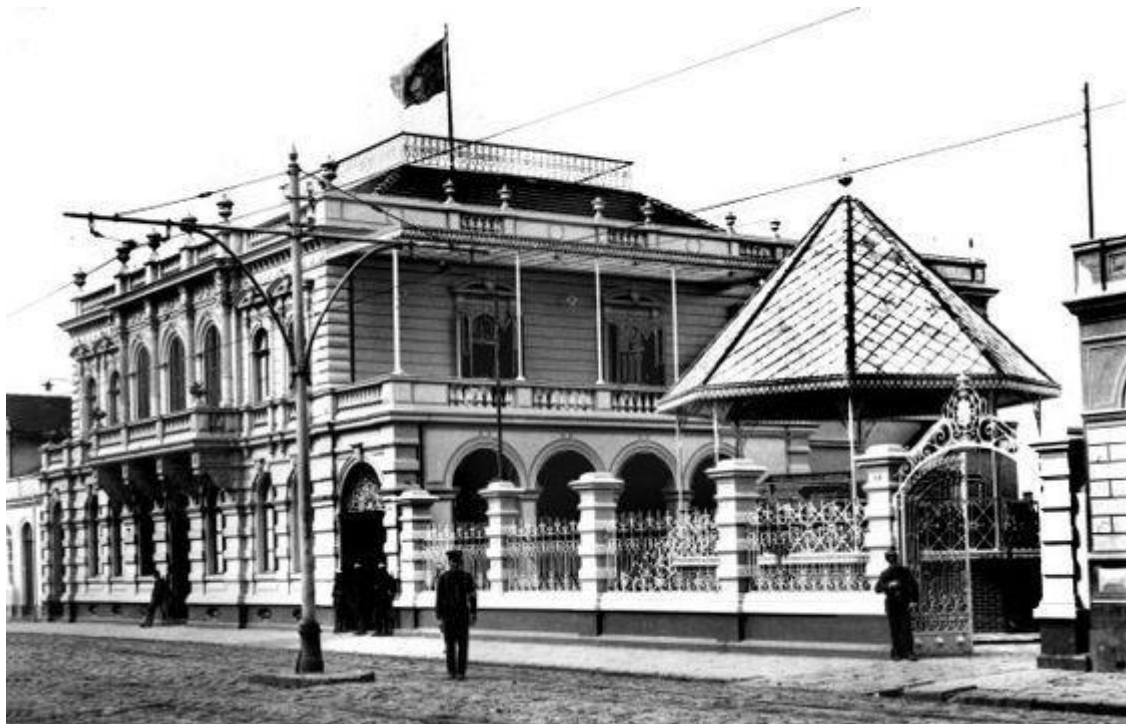
FIGURA 3 - PALÁCIO DA LIBERDADE, 1914