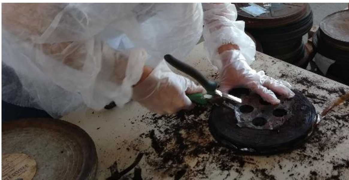
FIGURA 8 – LIMPEZA DE PELÍCULA EM PROCESSO DE DETERIORAÇÃO

Uma espiral gruda na outra de tal forma que se torna impossível desenrolar a película. Algumas vezes a liberação de ácido acético é tão intensa que, somada à absorção de umidade, dissolve a emulsão, chegando a formar uma espécie de melaço ou mingau escuro no fundo da lata. Quando chega nesse ponto, o filme está perdido, não é mais recuperável (Coelho, 2006, p. 44)