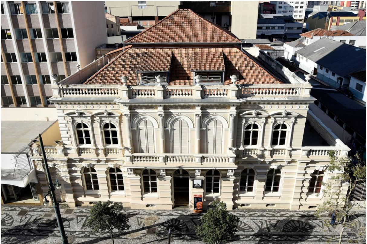
FIGURA 2 - FACHADA DO MUSEU DA IMAGEM E DO SOM DO PARANÁ