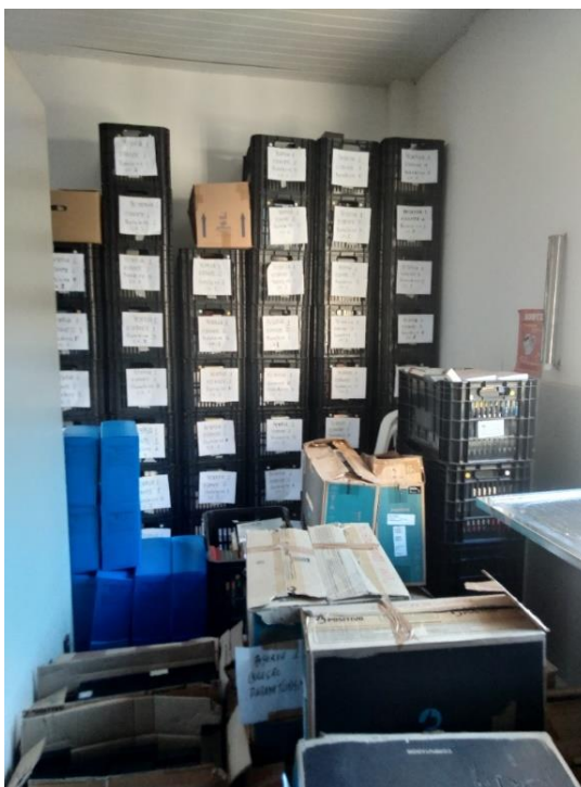
FIGURA 10 – RESERVA DE FITAS MAGNÉTICAS

Além do acervo de películas em rolos, o MIS-PR também conta com um vasto acervo de fitas magnéticas (VHS 43 , U-matic 44 , Betamax 45 , dentre outras), sendo que algumas das coleções encontram-se armazenadas em caixas em uma das salas do museu, como pode ser visto nas imagens seguintes.