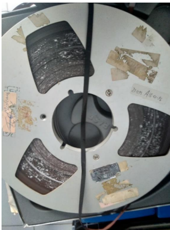
FIGURA 12 – FITA MAGNÉTICA COM FUNGOS