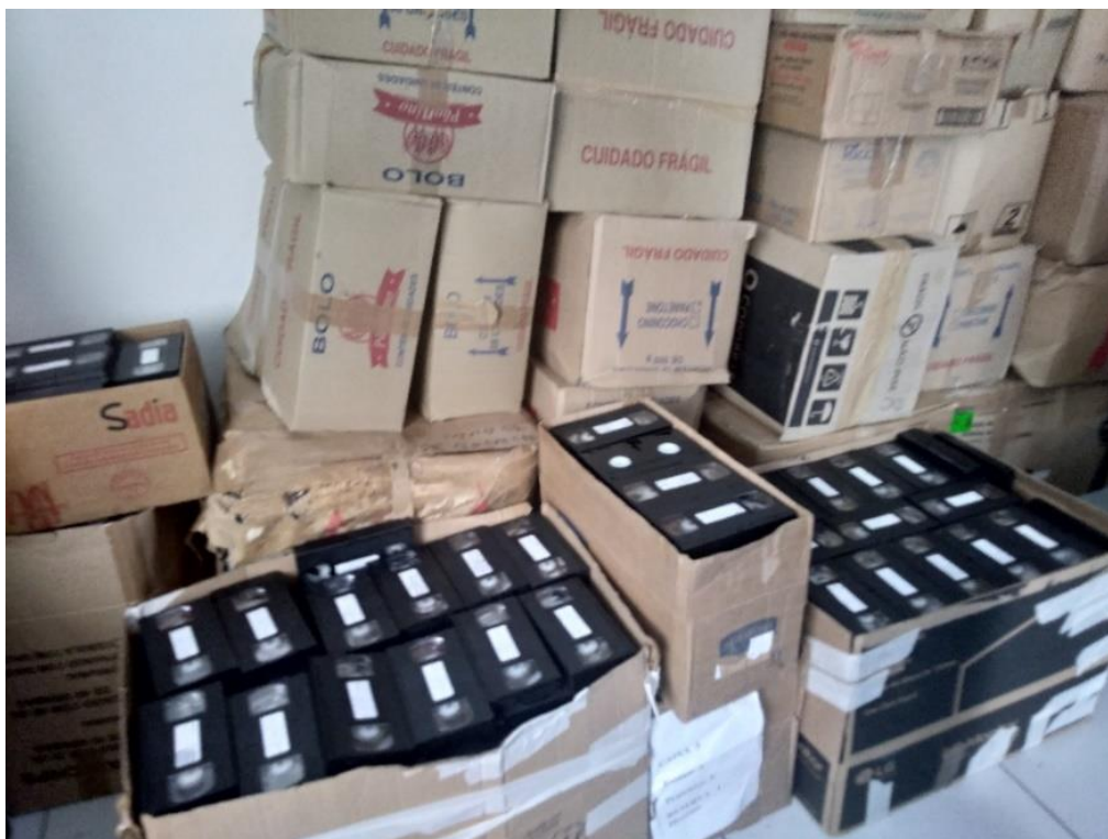
FIGURA 11 – RESERVA DE FITAS MAGNÉTICAS