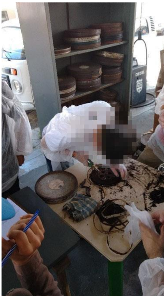
FIGURA 7 – LOCAL DE MANUSEIO DAS PELÍCULAS