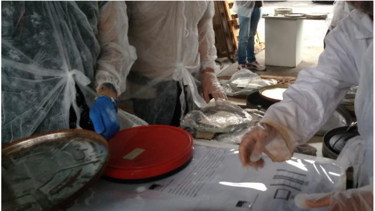
FIGURA 5 – MANUSEIO E LIMPEZA DAS PELÍCULAS