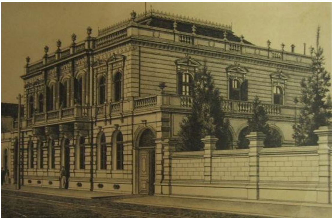
FIGURA 1 - GRAVURA DE 1880