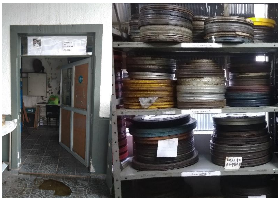
FIGURA 9 – RESERVA DOS FILMES

Destaco que o acervo do MIS-PR também conta com películas em suporte de nitrato 39 de celulose que podem sofrer decomposição desencadeada principalmente pelo contato com água ou com a exposição a altas taxas de umidade. Esse processo de degradação, que é lento, porém extremamente prejudicial é conhecido como hidrólise que “[...] indica a forma mais grave de deterioração desse material, que tem grande capacidade de absorver umidade” (Coelho, 2006, p. 45), que pode vir a destruir completamente a película. Esse processo de deterioração também se encontra presente em algumas películas do acervo do museu, fazendo com que seja impossível o acesso ao conteúdo dos registros audiovisuais deteriorados, restando apenas o título como referência à esse registro que ficará para sempre perdido. De acordo com Natália de Castro “[...] cada tipo de suporte exige condições específicas de revisão e armazenamento e o arquivo deve fazer o possível para segui-las, de acordo com suas possibilidades” (Castro, 2023, p. 59).