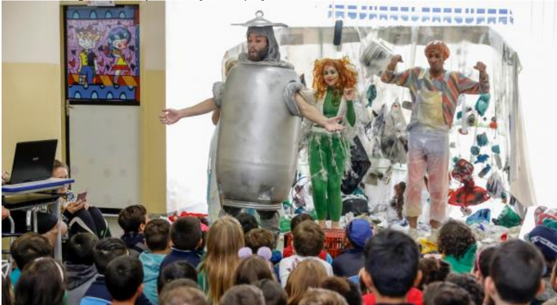
Figura 16 - Apresentação da peça “Heróis Naturais”, em Araucária/PR.

acrescenta: “então se você estiver no teatro amanhã, é muito possível que você tenha lá uma parte, uma pequena parte do público, que nunca tenha ido assistir um espetáculo”. Sobre os locais em que apresenta suas peças fora da cidade de Araucária, diz que nas cidades da Lapa e Campo Largo, por exemplo, ocorrem dentro de edifícios teatrais.