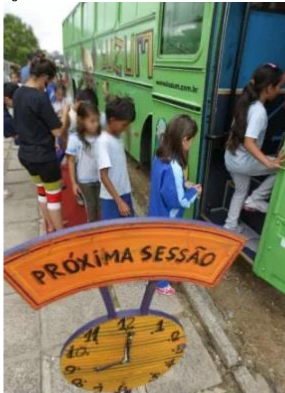
Figura 6 - Alunos entrando no ônibus do BuZum!

Gutierrez (2022) participou de todo o projeto no campo e acompanhou as prestações de contas, o que a fez aprender a criar planilhas que facilitam a prestação de contas e a ida do projeto ao campo. Ressalta que há “algumas dificuldades de projetos itinerantes em leis de incentivo, que você não consegue prever determinadas situações que você vai encontrar no campo”. Por isso, atualmente entende que seus projetos são muito mais bem escritos, pois consegue prever muitas coisas que poderão acontecer durante a execução das propostas.