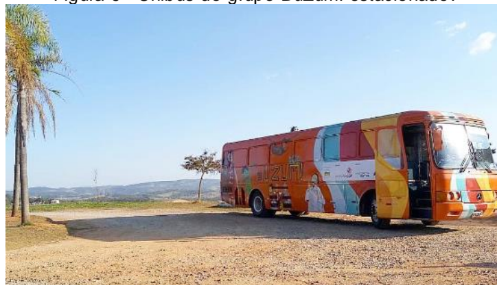
Figura 9 - Ônibus do grupo BuZum! estacionado.