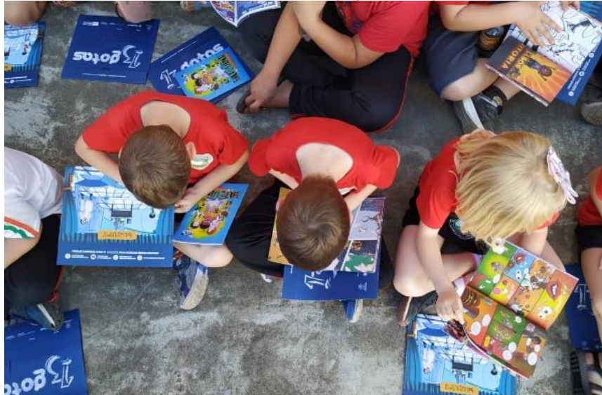
Figura 10 - Alunos com material pedagógico entregue pelo BuZum!.