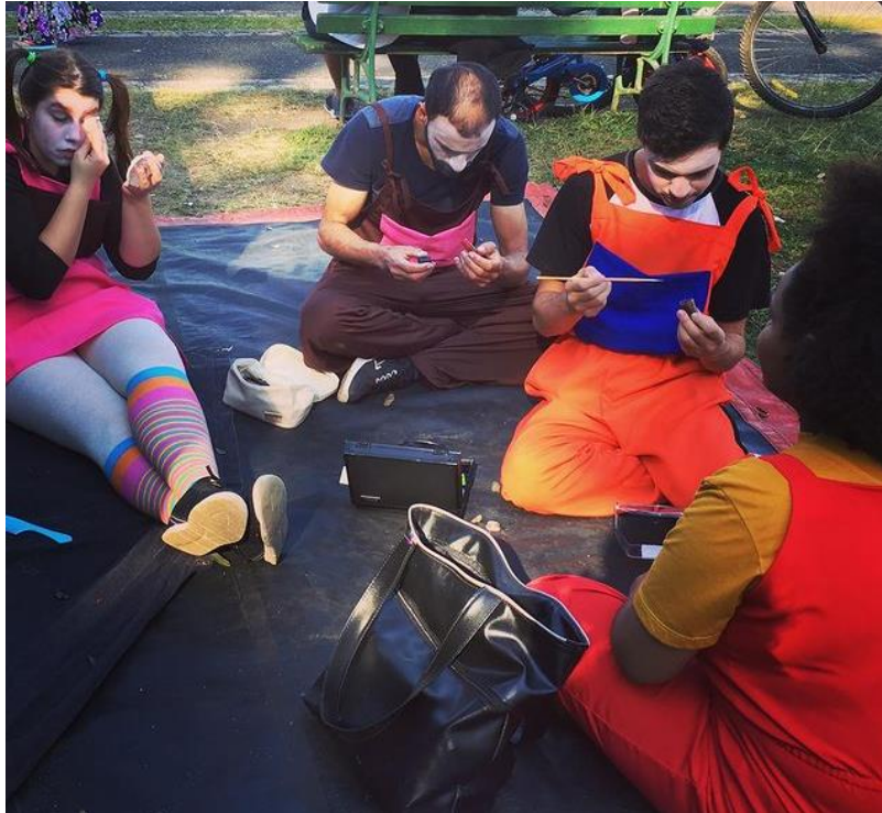
Figura 17 - Atores em preparação para ensaio aberto da peça “Trato É Trato, Não Maltrate os Animais”, de Jester Furtado.

Fonte: disponível no instagram da Cia Senhores Furtados 20 , 2018.