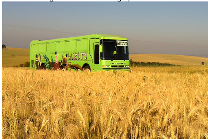
Figura 2 - Ônibus do grupo BuZum!.