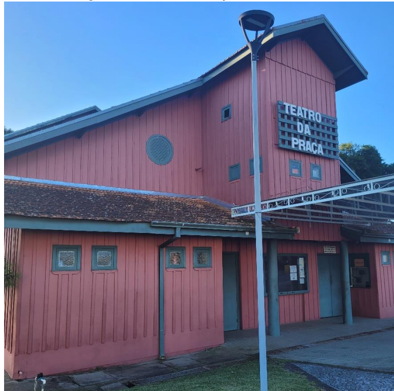
Figura 5 - Teatro da Praça, Araucária/PR.