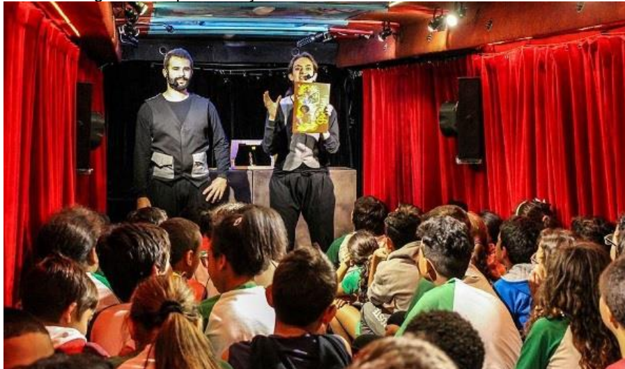
Figura 7 - Apresentação da cia BuZum! dentro do ônibus.