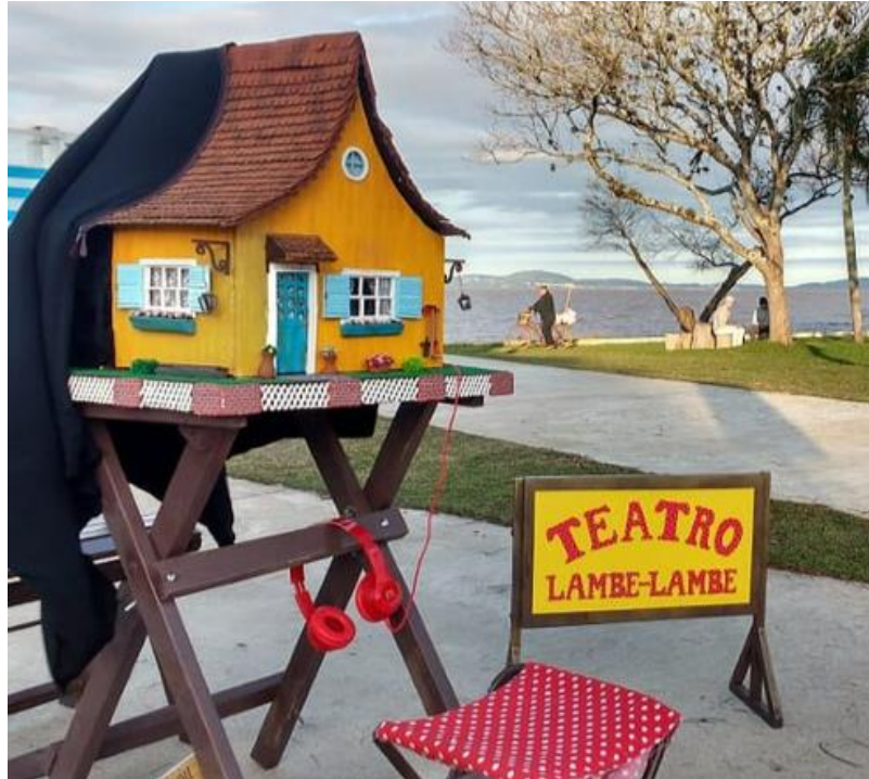
Figura 13 - Caixa do teatro lambe-lambe, do grupo Realejo Encena.