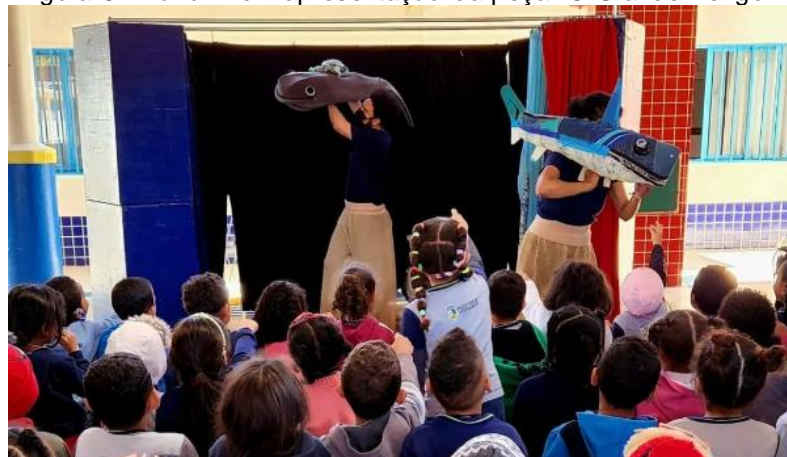
Figura 8 - BuZum! em apresentação da peça "O Grande Perigo".